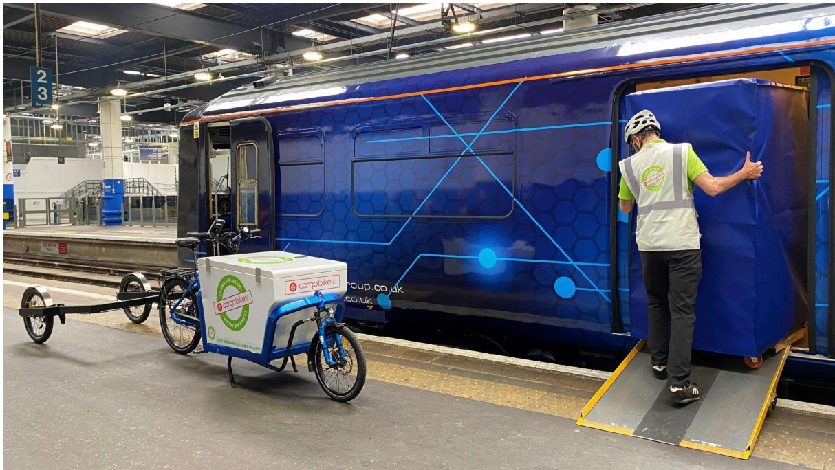
Orion Class 769 converted from a Class 319 EMU is discharged at Euston Station.